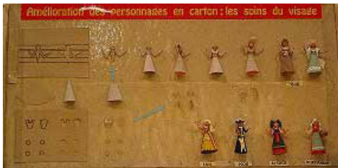
Photo 9 ▲ : Une boîte "pédagogique" complémentaire pour améliorer les figurines en affinant les visages.

Une fois le montage terminé, les personnages sont peints par touches successives, en partant des tons les plus clairs pour finir par les plus foncés tout en laissant suffisamment sécher entre les différentes applications. Pour ne pas endommager le carton qui absorbe l'eau, une peinture sans eau est recommandée (glycéro Humbrol par exemple). Pour faciliter et rentabiliser le travail, les personnages sont scotchés et déposés sur un support (planchette disposant d'un adhésif) pour être peints en « série ».