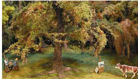
Photo 6 ▲ : "L'arbre, l'artiste et la vache". Le superbe feuillage a vraisemblablement été fabriqué selon la méthode "ficelle de sisal", évoquée plus bas.