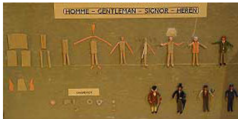
Photo 8 ▲ : ...ou masculins. Vu comme ça, cela paraît si simple...

Une fois le montage terminé, les personnages sont peints par touches successives, en partant des tons les plus clairs pour finir par les plus foncés tout en laissant suffisamment sécher entre les différentes applications. Pour ne pas endommager le carton qui absorbe l'eau, une peinture sans eau est recommandée (glycéro Humbrol par exemple). Pour faciliter et rentabiliser le travail, les personnages sont scotchés et déposés sur un support (planchette disposant d'un adhésif) pour être peints en « série ».