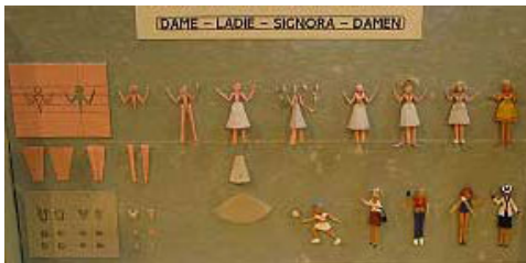
Photo 7 ▼ : Méthodologie pour fabriquer des personnages féminins... -