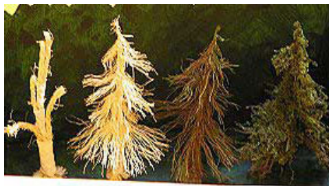
Photos 11 ▲ - 12 ▼ : De la ficelle de sisal, un peu de papier encollé (?...) pour réunir les brins et former le tronc, de la teinture, du flochage (de récupération ?...) et hop, un arbre économique. Des feuillus ou des résineux, oui, oui, c'est possible.