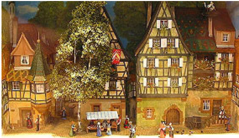
Photo 5 ▲ : "Scène de rue en Alsace au début du XXème s.". Façades de maisons typiques, costumes régionaux des personnages, tout y est, même les cigognes...