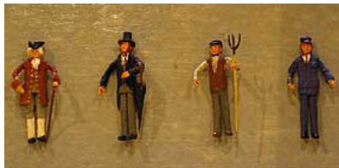
Photo 10 ▲ : Détail sur quelques personnages masculins obtenus par la méthode décrite à la photo 8.